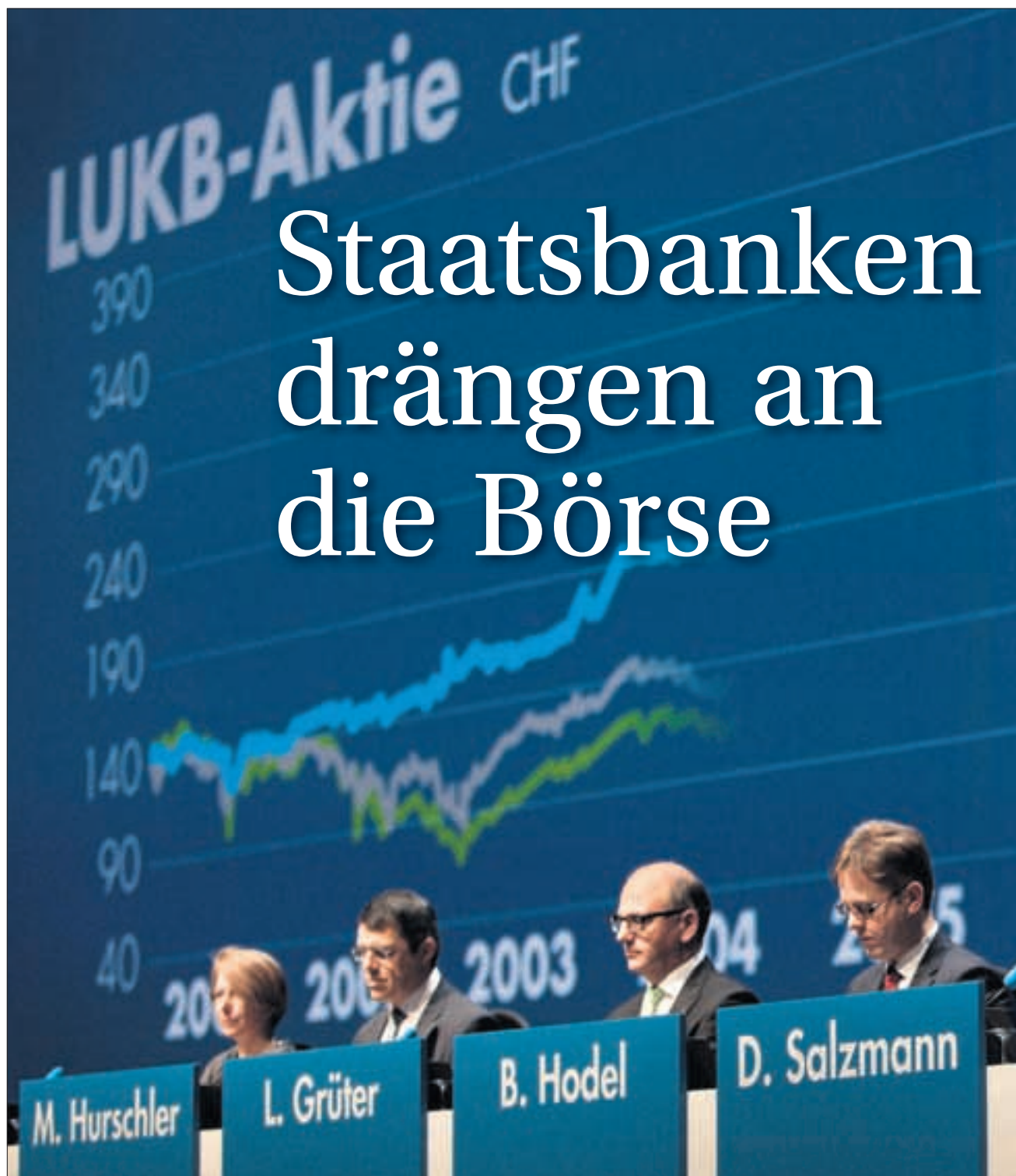
Anleger können mit Aktien der LUKB handeln. Dieser Schritt hat sich für die Staatsbank gelohnt.