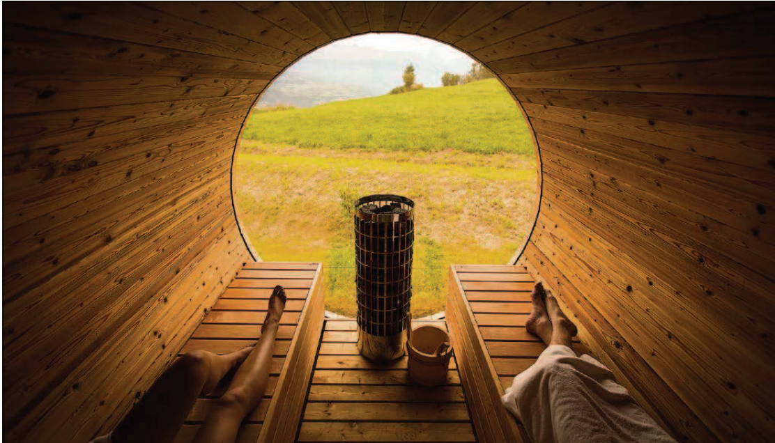
Schöne Aussichten dank Crowdfunding: Das Hotel Maya in Nax profitiert vom Werbeeffect der so finanzierten Sauna, der Zahler von Gutscheinen.