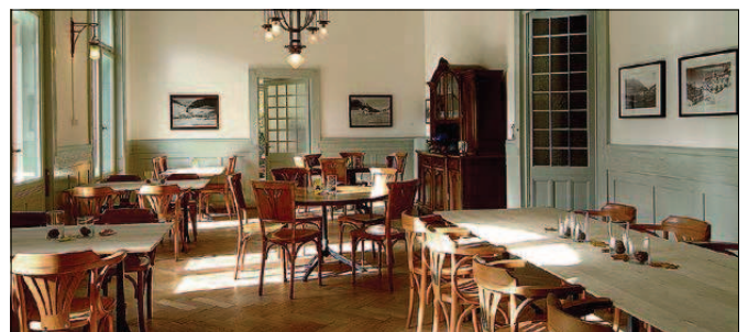
Renoviert: Speisesaal im Kurhaus Bergün. Dank Denkmalpflege.