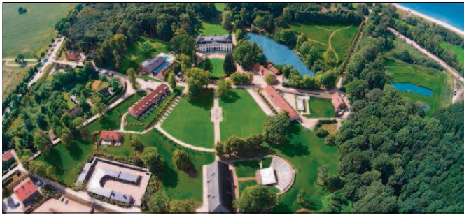
Das neue Luxus-Resort Weissenhaus an der Ostsee: Künftig noch grösser dank Crowdfunding.