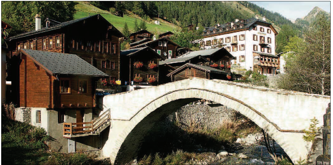
Öffentliche und private Gelder als Brückenbauer: Historische Hotels wie das Hotel Ofenhorn können auf Unterstützung zählen.