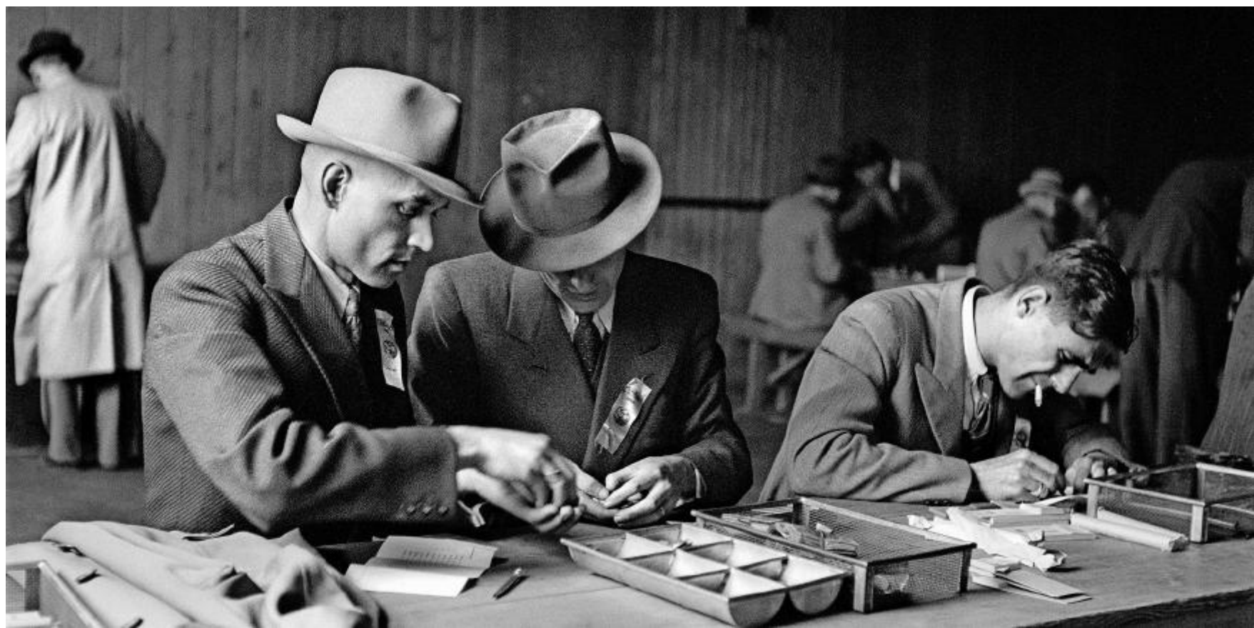
Elektronisches Geld war damals noch kein Thema: 1944 wird im Wankdorfstadion in Bern vor dem Cupfinal die Kasse vorbereitet.

Wie wäre es aber, wenn einer bezahlt und die anderen überweisen ihm ihren Betrag fürs Kinobillet ad hoc mit dem Smartphone? Mit einer App (siehe Box) will SIX Payment Services in Zusammenarbeit mit grösseren Schweizer Banken diesen Service ermöglichen. Starttermin ist Ende 2014 geplant. Die App, mit der Freunde und Bekannte untereinander Rechnungen begleichen können, ist ein erster Schritt – wenn auch noch in