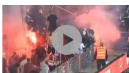
Heftige Krawalle bei Kopenhagen-Derby