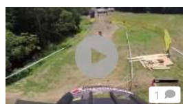
Schweizer Mountainbiker auf Testfahrt