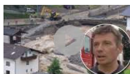
Schwere Unwetter in Österreich