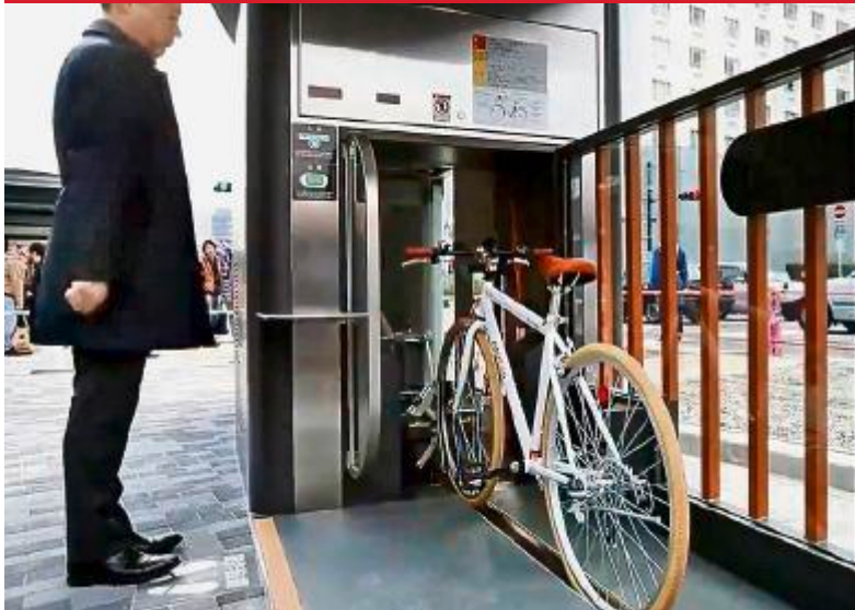
Wie hier in Tokio sollen die Velos auch in Luzern per Lift ... YOUTUBE