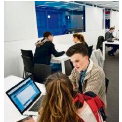
Hier treffen sich Start-up-Gründer. P. KETTERER

Coiffeursalons, ein Catering Service, ein Online-Reisebüro und ein Werbebüro. PZ Hslu.ch/smart-up